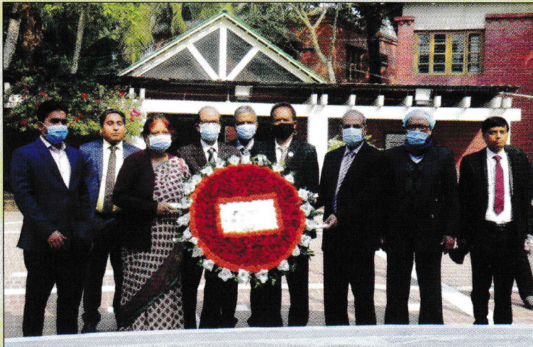
জাতির পিতার সমাধিসৌধে বাংলাদেশ প্রতিযোগিতা কমিশনের পুষ্পস্তবক অর্পণ