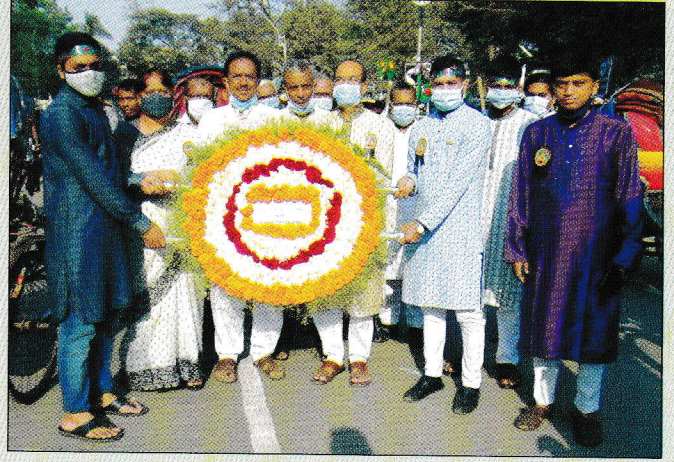
শহীদ দিবস ও আন্তর্জাতিক মাতৃভাষা দিবস উপলক্ষে কমিশন কর্তৃক ঢাকা কেন্দ্রীয় শহীদ মিনারে শ্রদ্ধাঞ্জলি জ্ঞাপন ও পুষ্পস্তবক অর্পণ