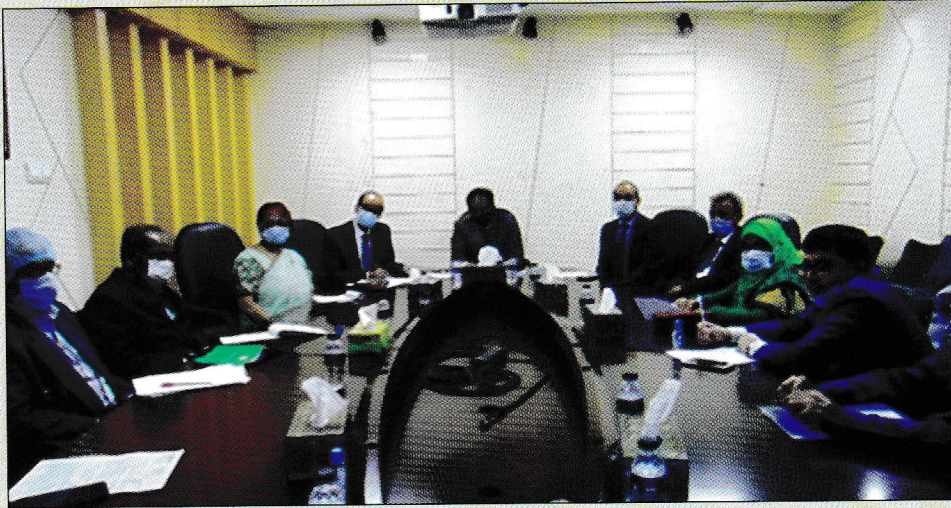
SMS ও অন্যান্য Value Added Service এর সেবা বাজার সম্পর্কে এবং এ সম্পর্কিত প্রতিযোগিতা আইন, ২০১২ এর বিধান সম্পর্কিত একটি আন্তঃমন্ত্রণালয় সমন্বয় সভা