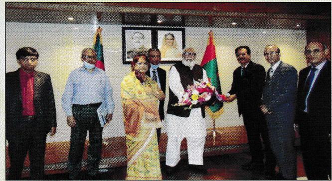
মাননীয় প্রধানমন্ত্রীর বেসরকারী বিনিয়োগ বিষয়ক উপদেষ্টা জনাব সালমান এফ রহমানের সাথে কমিশনের চেয়ারপার্সন ও সদস্যগণের সৌজন্য সাক্ষাৎ