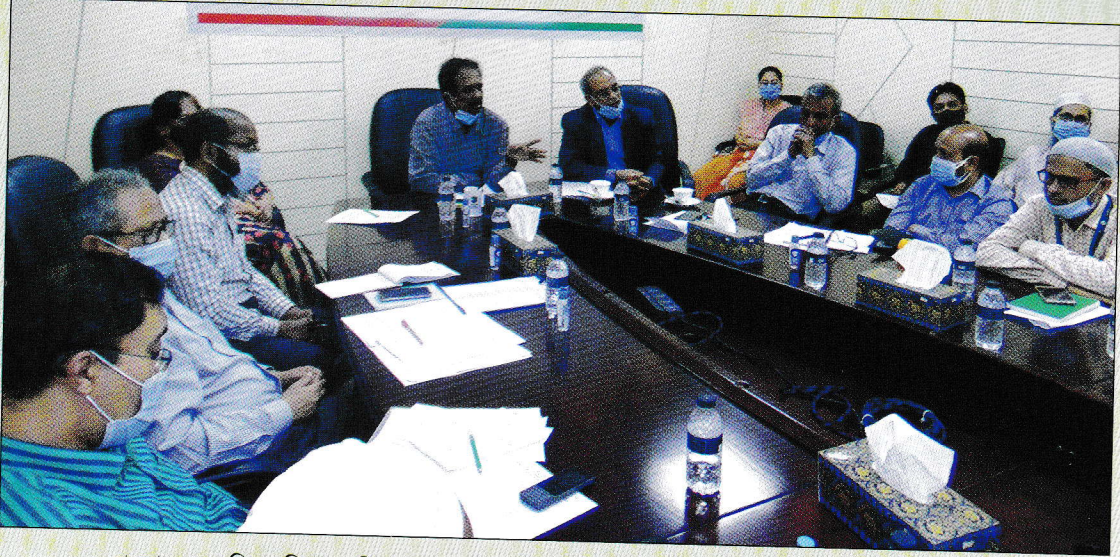
বাংলাদেশ প্রতিযোগিতা কমিশনের সম্মেলন কক্ষে পেঁয়াজের অস্বাভাবিক মূল্য ও সরবরাহজনিত কারসাজি প্রতিরোধের লক্ষ্যে আয়োজিত সভা