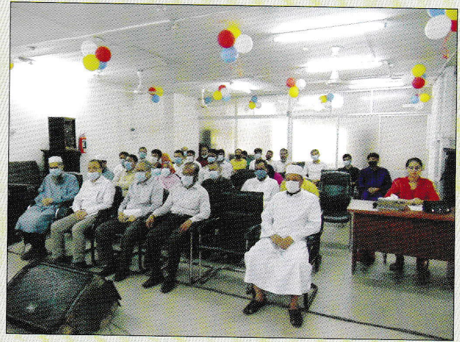
কমিশন কর্তৃক জাতির পিতা বঙ্গবন্ধু শেখ মুজিবুর রহমানের জন্মশতবার্ষিকী ও জাতীয় শিশু দিবস ২০২১ পালন