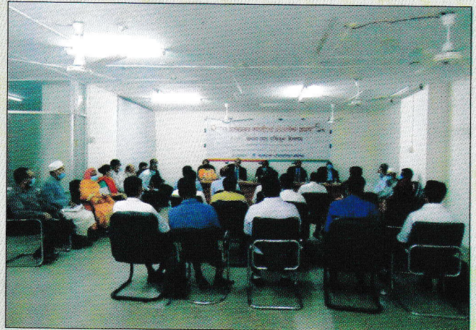
কমিশন কর্তৃক গ্রেড-১৩ থেকে গ্রেড-১৬ বেতনস্কেলে যোগদানকৃত নতুন কর্মচারীদের জন্য ওরিয়েন্টেশন কর্মসূচী