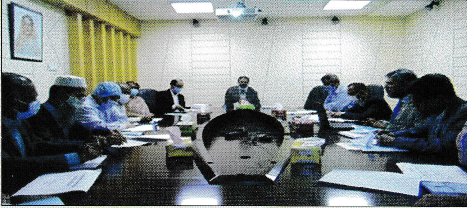
বাংলাদেশ প্রতিযোগিতা কমিশনের আয়োজনে দেশের ভোজ্য তেলের বাজারে অস্বাভাবিক মূল্য বৃদ্ধির কারণ যাচাই এবং এতদসংক্রান্ত বিষয়াদি পর্যালোচনা সংক্রান্ত মতবিনিময় সভা