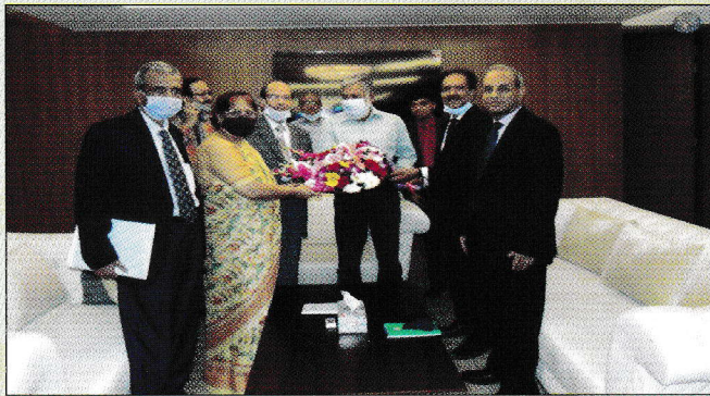
বাংলাদেশ বিনিয়োগ উন্নয়ন কর্তৃপক্ষের (বিডা) চেয়ারম্যানের সাথে কমিশনের চেয়ারপার্সন ও সদস্যগণের সৌজন্য সাক্ষাৎ

বিগত ২০২০ সালের শেষ সময় থেকে ২০২১ সালের শুরুর দিকে মহামারী কোভিড-১৯ এর প্রকোপ কিছুটা কম থাকায় এ সময় বাংলাদেশ প্রতিযোগিতা কমিশন বাণিজ্য মন্ত্রণালয়, খাদ্য মন্ত্রণালয়, কৃষি মন্ত্রণালয়, নৌ পরিবহন মন্ত্রণালয়, বাংলাদেশ ব্যাংক, বাংলাদেশ বিনিয়োগ উন্নয়ন কর্তৃপক্ষ, বিটিআরসি, বীমা উন্নয়ন কর্তৃপক্ষ, সমুদ্র পরিবহন অধিদপ্তরের প্রধান/প্রতিনিধিগণের সাথে বিভিন্ন গুরুত্বপূর্ণ বিষয়ে মতবিনিময় করেছে।