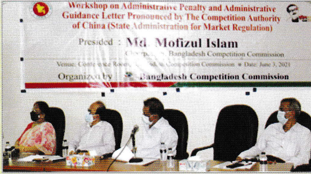
Administrative Penalty and Administrative Guidance Letter Pronounced by The Competition Authority of China (State Administration for Market Regulation) শীর্ষক কর্মশালায় উপস্থিত কমিশনের চেয়ারপার্সন ও সদস্যবৃন্দ