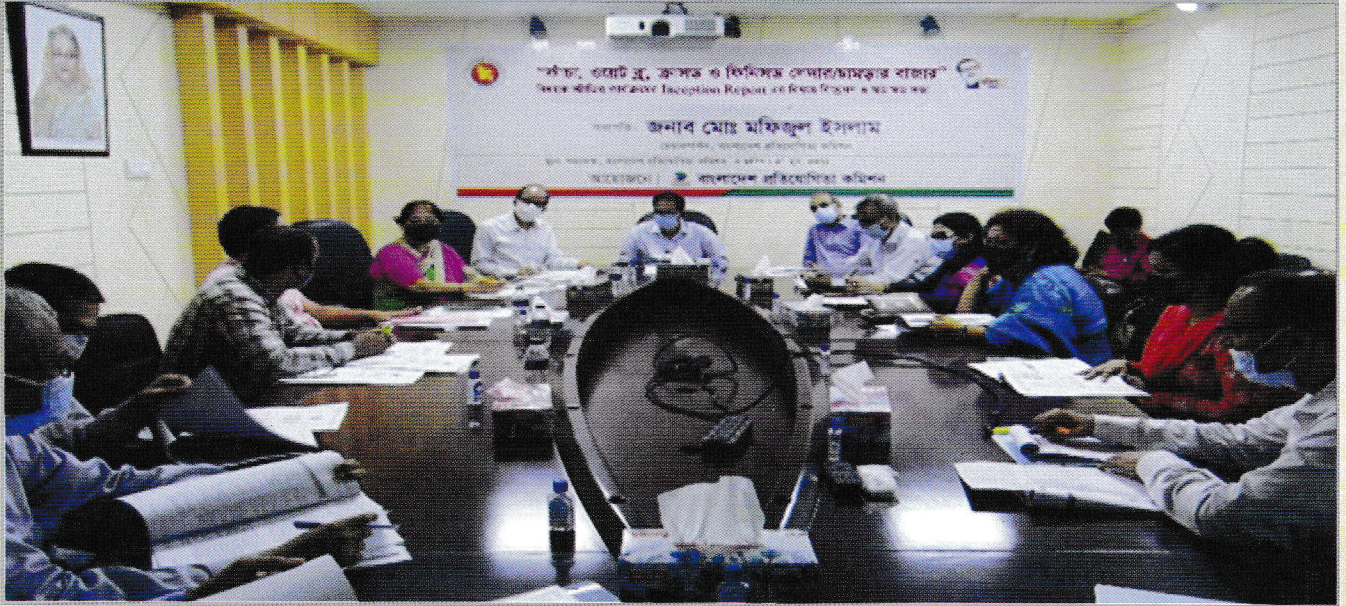
কাঁচা, ওয়েট ব্রু, ক্রাসড ও ফিনিসড লেদার/চামড়ার বাজার বিষয়ক স্টাডি কার্যক্রমের Inception Report এর বিষয়ে বিশ্লেষণ ও মতামত প্রদান সংক্রান্ত সভা