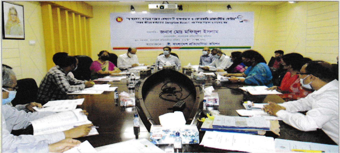
স্বাস্থ্যসেবা খাতের বাজার বেসরকারি হাসপাতাল ও বেসরকারি ডায়াগনস্টিক বিষয়ক স্টাডি কার্যক্রমের Inception Report এর বিষয়ে বিশ্লেষণ ও মতামত প্রদান সংক্রান্ত সভা