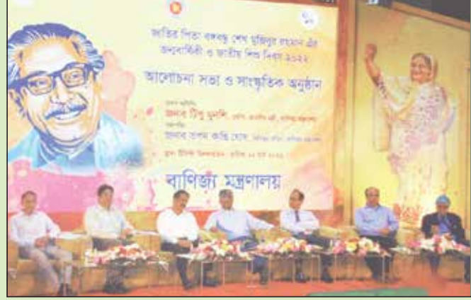
জাতির পিতা বঙ্গবন্ধু শেখ মুজিবুর রহমানের জন্মবার্ষিকী এবং জাতীয় শিশু দিবস উদযাপন