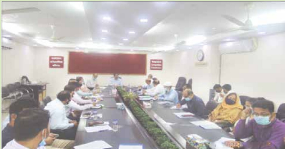
BIWTA, লঞ্চ মালিক সমিতিসহ অন্যান্য অংশীজনের সাথে মতবিনিময় সভা