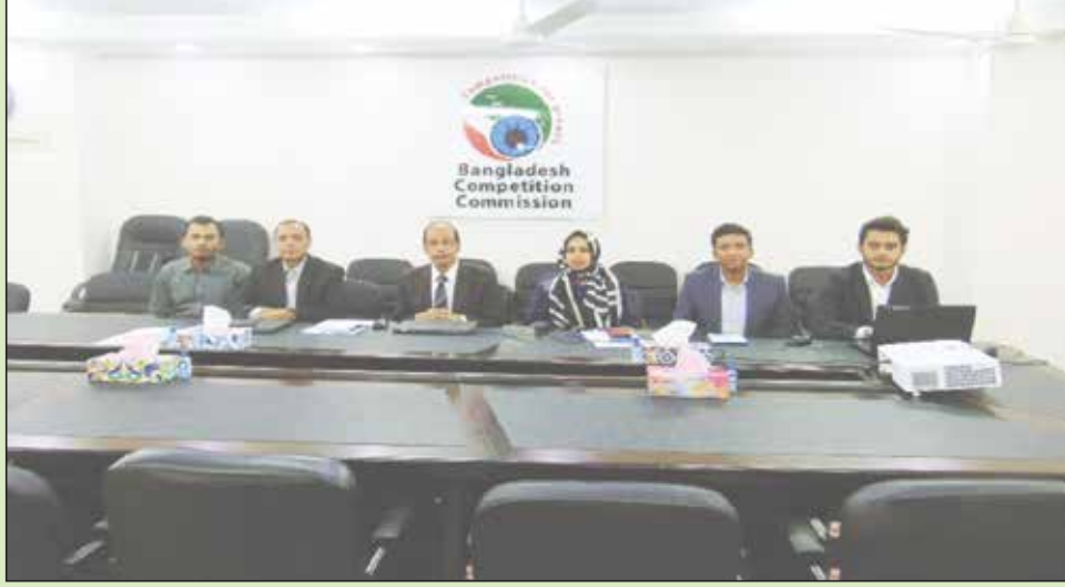
Meeting on Voluntary Peer Review of the Competition Act, 2012 বিষয়ক সভা