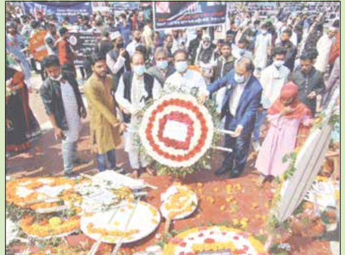
শহিদ দিবস ও আন্তর্জাতিক মাতৃভাষা দিবস উপলক্ষে কমিশন কর্তৃক ঢাকা কেন্দ্রীয় শহিদ মিনারে শ্রদ্ধাঞ্জলি জ্ঞাপন ও পুষ্পস্তবক অর্পণ