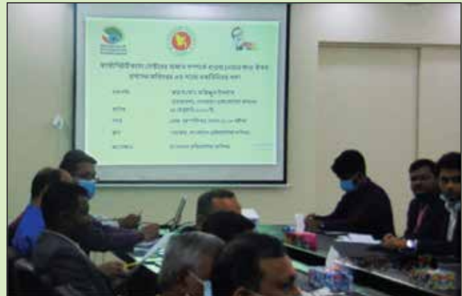
ঔষধ প্রশাসন অধিদপ্তরের সাথে ফার্মাসিউটিক্যাল সেক্টরের কার্যক্রম সম্পর্কিত মতবিনিময় সভা